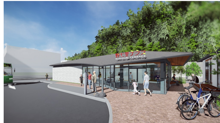
上郷ネオポリス コミュニティ施設完成予想図