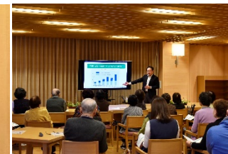
医師による転倒予防教室