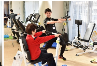
運動指導員による運動指導