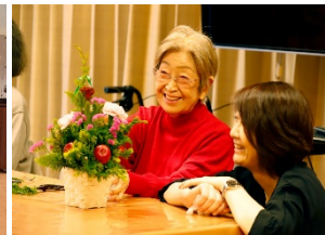
フラワーアレンジメント教室