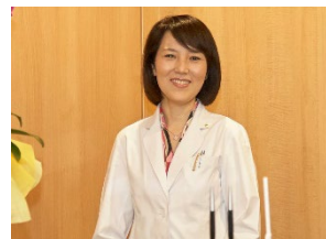
看護師資格を有するスタッフの配置