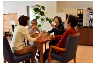
キッツキカフェでの団欒