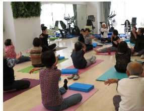
運動プログラム(ストレッチ)