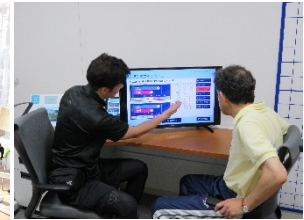
個人に合わせた運動メニューの作成