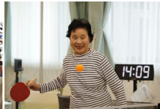
豊富なサークル活動(卓球クラブ)