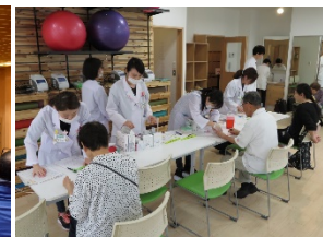
薬局連携:けんこうフェア共同開催