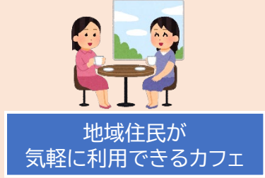
地域住民が気軽に利用できるカフェ