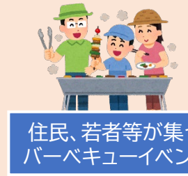
住民、若者等が集うバーベキューイベント