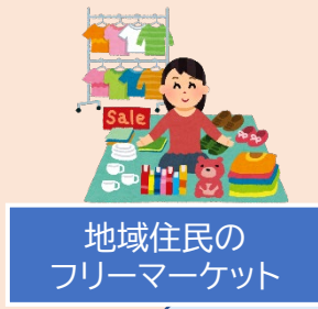
地域住民のフリーマーケット