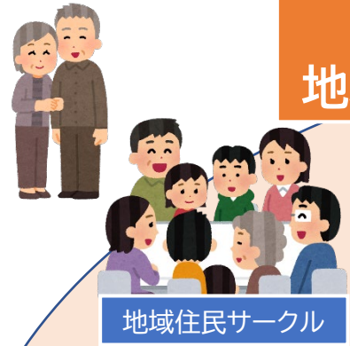
地域住民サークル