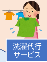
洗濯代行サービス