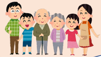
お子様から、お年寄りまで気軽に寄れる場所づくり