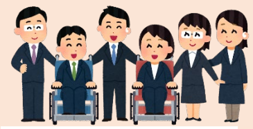
障がいがあっても、高齢になっても働ける場所づくり