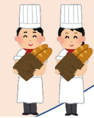
焼き立てベーカリーパン屋さん