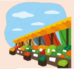
地元農家マルシェ