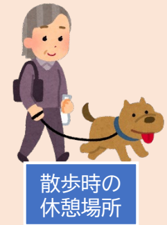
散歩時の休憩場所