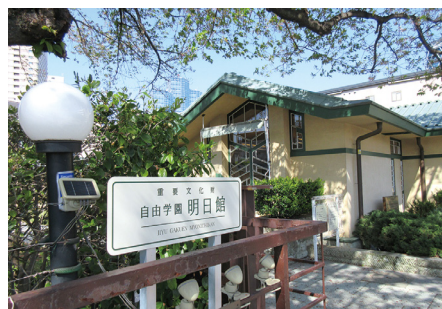
重要文化財建築の明日館がお散歩コース