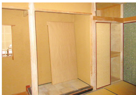
リフォーム前の住宅