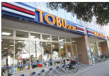
近くのスーパー・ドラッグストアまでは徒歩5分