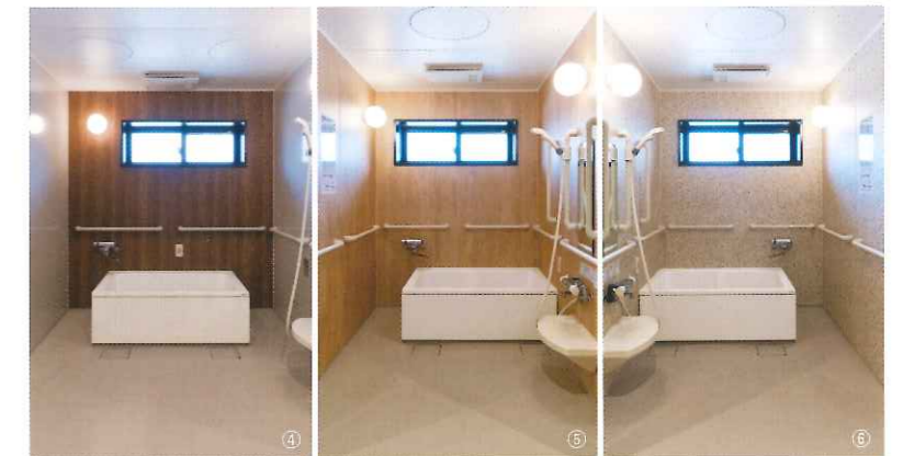
左から全身介護、左半身介護、右半身介護に対応する3つの個浴