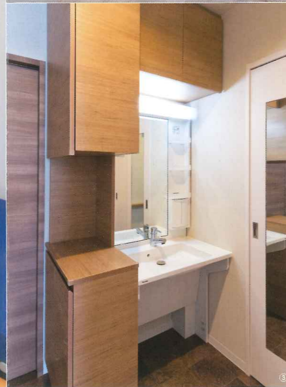
③「アクアハート洗面」の両サイドには収納スペースを確保