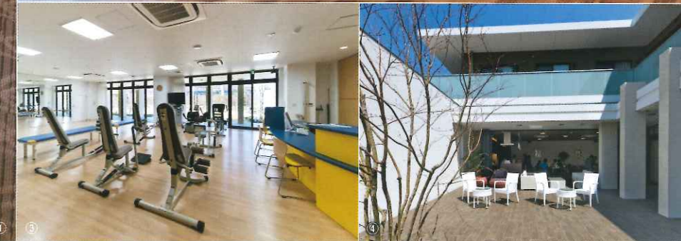
①スタッフが見渡せるように対面式のキッチンが設けられた、2階サ高住専用のリビング・ダイニング ②1階ショートステイのキッチンも対面式 ③地域の人も利用できる健康維持増進施設 ④地域に開かれたカフェ