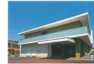
サンサーラ・レジデンス

所在地/大阪府寝屋川市成田東が丘 事業主/社会福祉法人百丈山合学会 設計/株式会社IAO竹田設計 施工/株式会社前田組 竣工/2016年9月