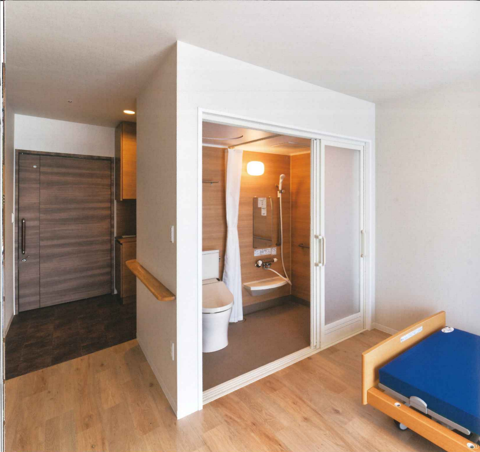
①各住戸に設置されたトイレ一体型シャワーブースはベッドからすぐにアクセスできるように計画されている ②壁面には手すりを兼ねた飾り棚を配置