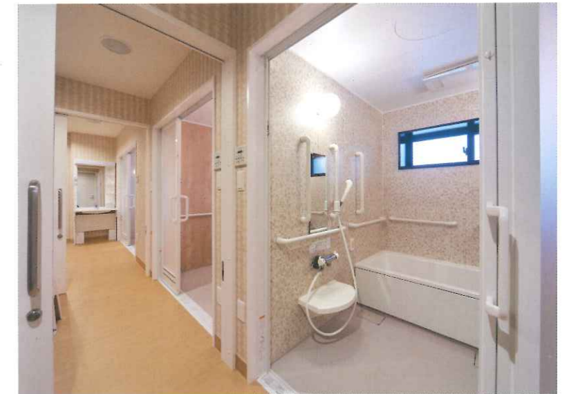
共用スペースに設置された3種類の個浴。3つの脱衣室は引き戸で仕切られている