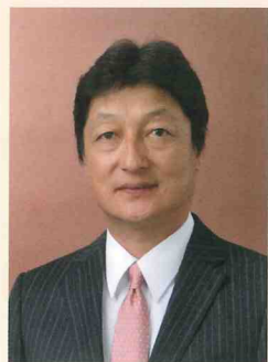
社会福祉法人 太陽会 理事長