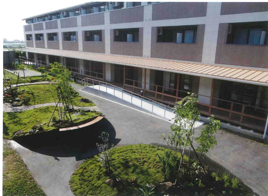
※国土交通省によるスマートウェルネス住宅等推進モデル事業