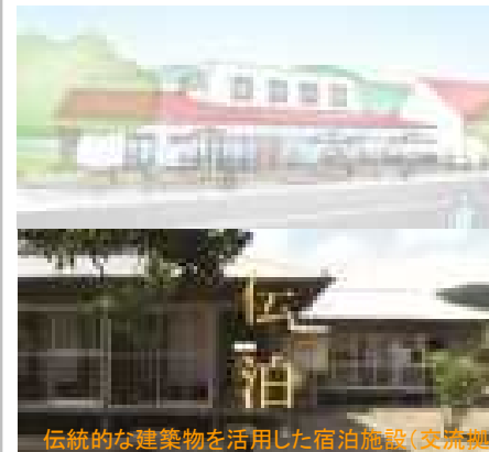
伝統的な建築物を活用した宿泊施設(交流拠点)